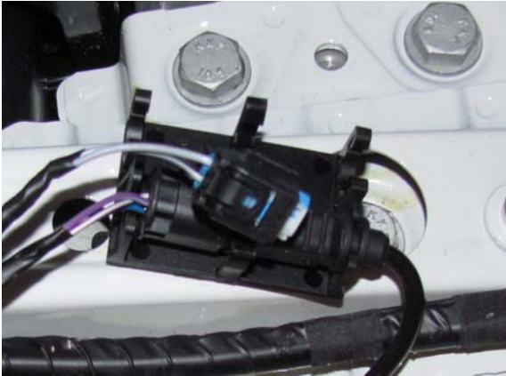
Steckersicherung Connector lock