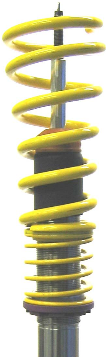
Angeliefertes Federbein. Supplied coilover strut.

Stützlager vom Serienfahrzeug auf den angelieferten Dämpfer montieren. Das Anzugsdrehmoment der Kolbenstangenbefestigung beträgt 35 Nm. Die Montagehinweise zum Einbau des Federbeines in das Fahrzeug, sowie die Anzugsdrehmomente der Federbeinbefestigung, entnehmen Sie bitte den Unterlagen des Fahrzeugherstellers.