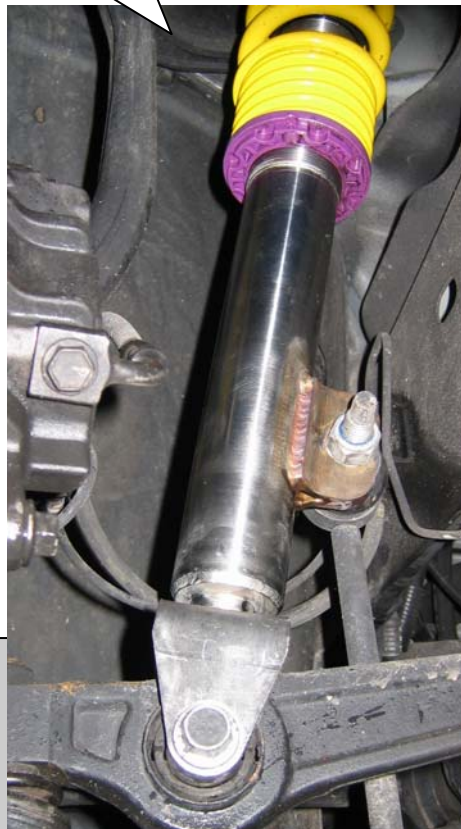
Montiertes Federbein. Installed coilover strut.

Mount the supporting bearing of the production car on the supplied shock absorber. Tightening torque for the piston rod is 35 Nm (26 ft-lb). Please install the strut unit to manufacturers recommended settings regarding tightening torque and fixing specifications.