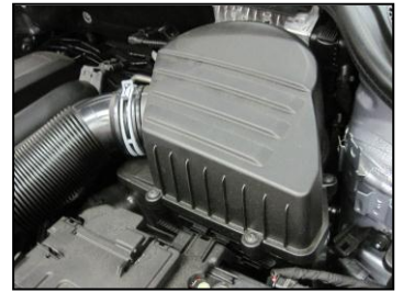
Fig. # 16