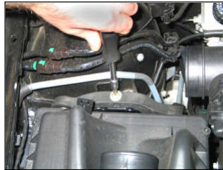
Fig. # 3