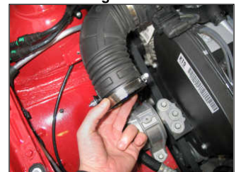
Fig. # 8