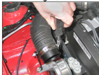
Fig. # 10