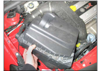
Fig. # 4