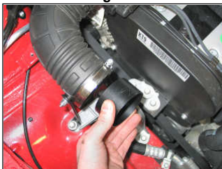
Fig. # 9