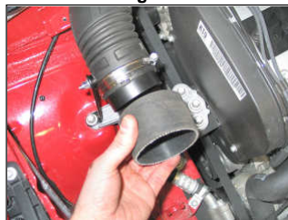
Fig. # 11