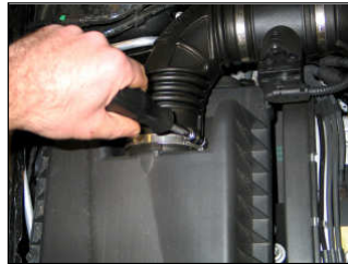
Fig. # 2