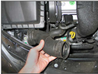
Fig. # 1

WARNING: Before starting the engine carry out a final fitment check of the K&N performance kit. It will be necessary for all intake systems to be checked periodically for realignment, clearance and tightening of all connections. Failure to follow the above instructions or proper maintenance may void the warranty.