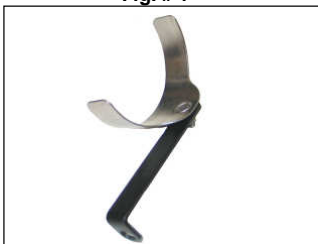
Fig. # 5