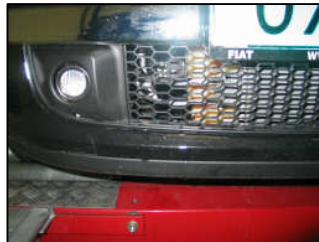
Fig. # 18