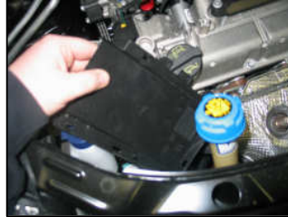
Fig. # 15