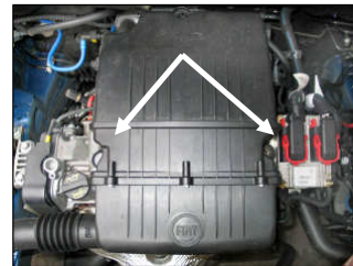
Fig. # 3