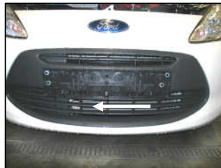
Fig. # 19