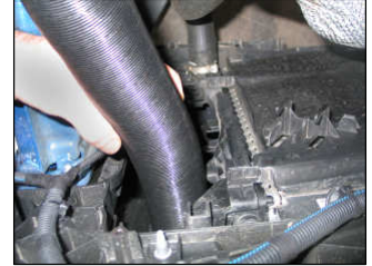
Fig. # 16