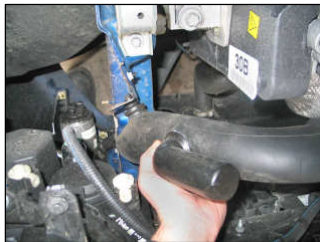
Fig. # 1

FILTER MAINTENANCE: K&N suggests checking the filter periodically for excessive dirt build-up. When the element becomes covered in dirt (or once a year), service it according to the instructions on the Recharger service kit available from your K&N dealer, part number 99-5003EU.