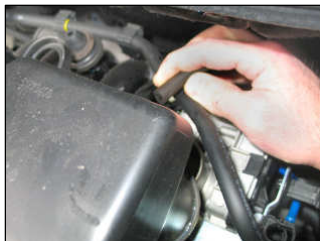
Fig. # 5