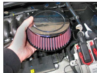
Fig. # 11