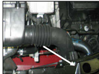
Fig. # 2