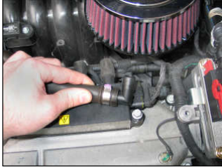
Fig. # 13