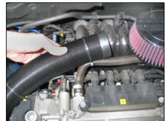
Fig. # 20