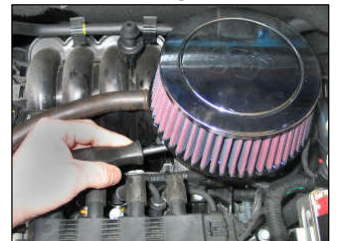
Fig. # 12