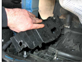
Fig. # 14