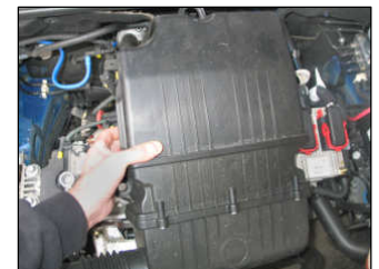
Fig. # 4