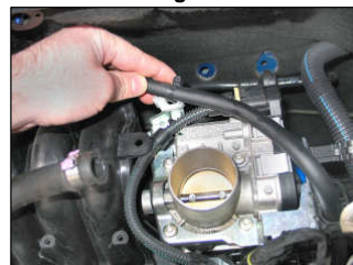
Fig. # 10