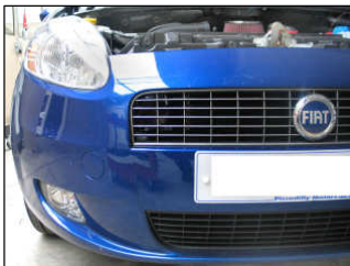
Fig. # 17