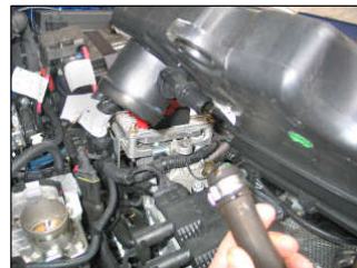
Fig. # 6