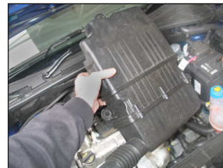
Fig. # 7