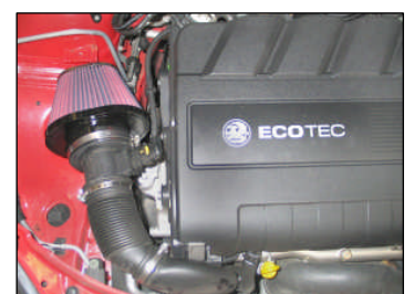
Fig. # 15