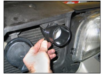
Fig. # 20