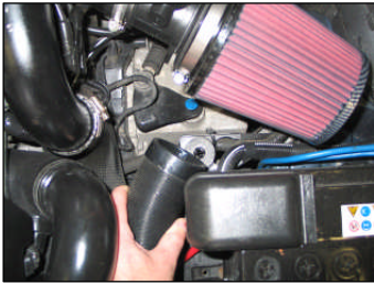
Fig. # 21