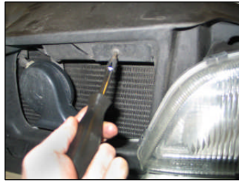
Fig. # 18