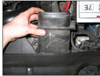
Fig. # 19