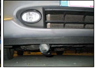
Fig. # 19