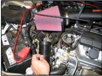
Fig. # 20