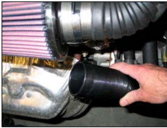
Fig. # 16