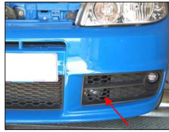
Fig. # 14