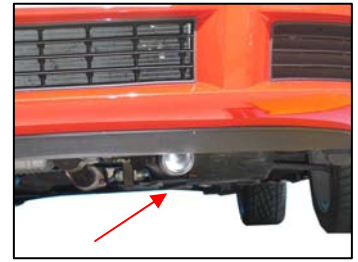
Fig. # 15